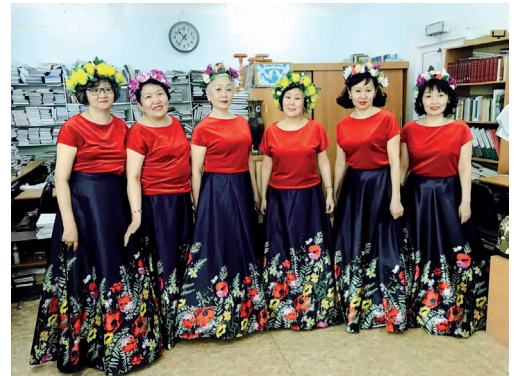
Ансамбль «Библиотекарь кыргыттар»